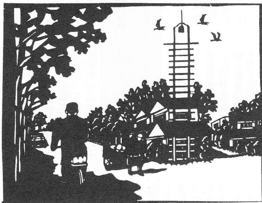
昭和15年頃の右が旧道、左が新川越街道、路の中にけやきがある。